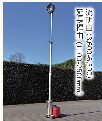
流明由 (3,600-6,300) 延長桿由 (1100-2500mm)