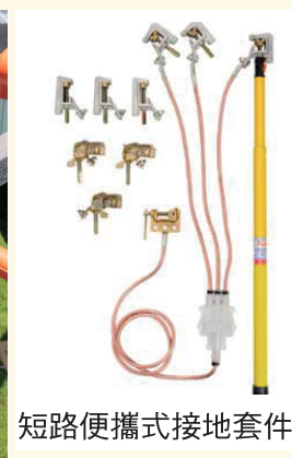
短路便攜式接地套件