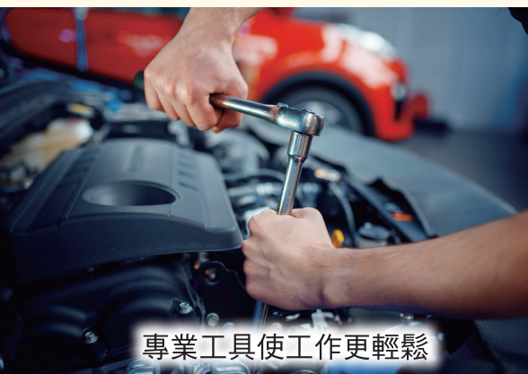
專業工具使工作更輕鬆