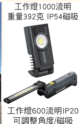
工作燈1000流明 重量392克 IP54磁吸