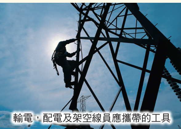
輸電，配電及架空線員應攜帶的工具