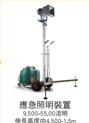
應急照明裝置 9,500-55,000流明 伸長高度由4,500-1.5m