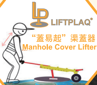
LIFTPLAQ “蓋易起”渠蓋器 Manhole Cover Lifter