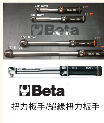
Beta 扭力扳手/絕緣扭力扳手